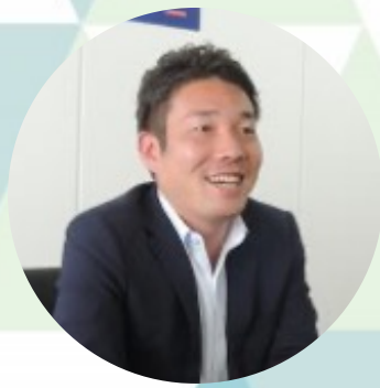
スポーツデータバンク株式会社 代表取締役