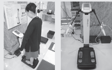
【左】測定の様子と測定機器「InBody」【右】