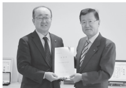
松浦会頭から松野市長へ要望を提出