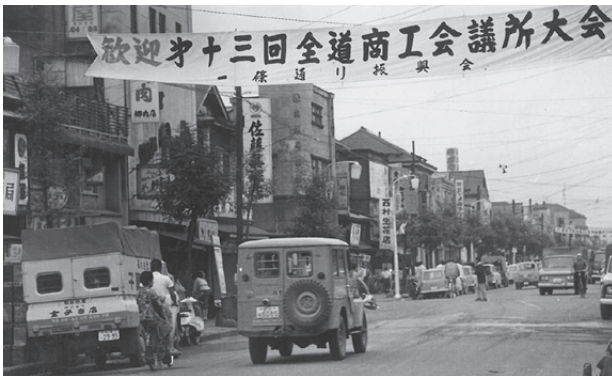
歓迎する1条通り振興会