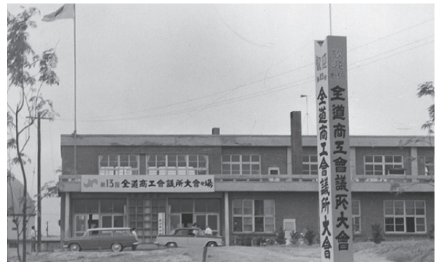
懇親会場となった東光中学校