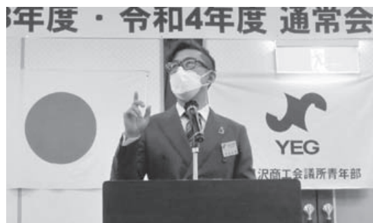
就任挨拶をする宮谷新会長

また、総会終了後の懇親会では協定を結んでいる宮古島商工会議所青年部7名が来場され10月7、8、9日に開催される「第42回九州ブロック大会宮古島大会」のPRを行い、交流を深めました。