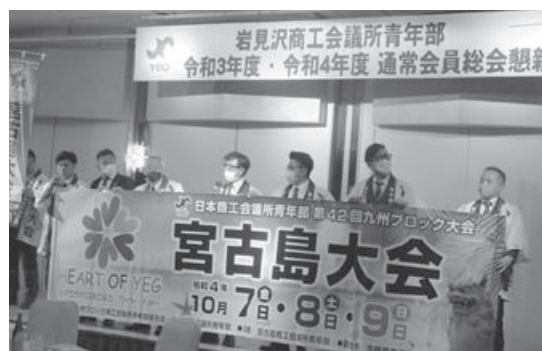
ブロック大会のPRをする宮古島YEG