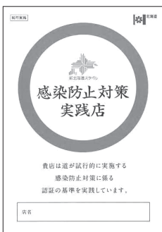
認証書のイメージ