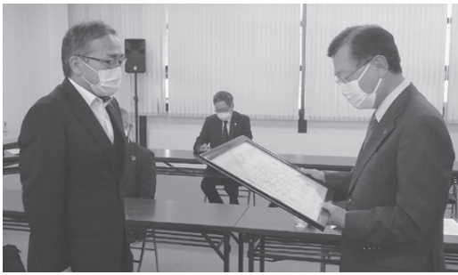
表彰を受ける仁志常議員(左)と代読する松浦会頭(右)