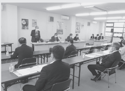
中小企業・商業合同委員会の様子

セミナー開催企画については、来年四月よりパワハラ防止措置が全企業に義務付けられることを受け、事例による対応、知識向上を目的とした「事例から学ぶパワハラ防止法対策セミナー」を十二月上旬に開催することとしました。