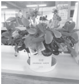
▲ピンクのシクラメン ▼赤いポインセチア