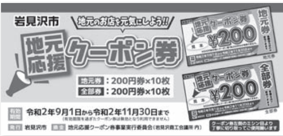
▲クーポン券表紙 ▼加盟店ポスター