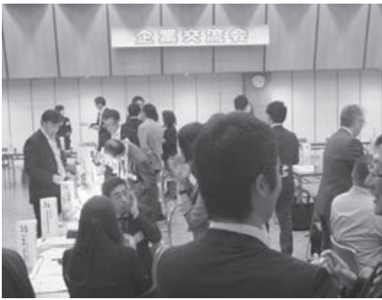
昨年の企業交流会の様子