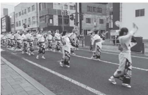
観光おどりパレード